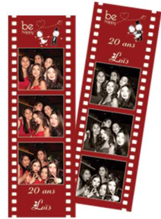
Strips photomaton Marques Pages

Logiciel CARD EDITOR pour création de vos maquettes personnalisées