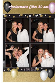
Multi vues par 2/3 ou 4