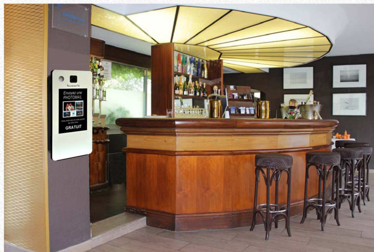
Accroché sur un mur