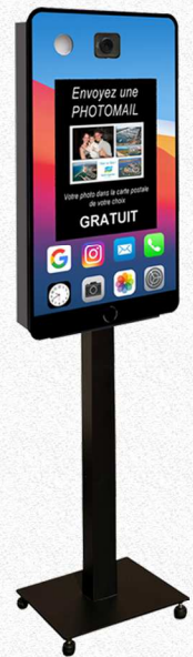
Face avant personnalisable