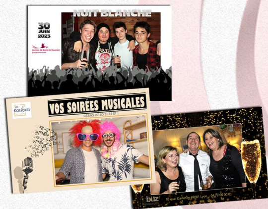
Boites de Nuit Bars à Thème