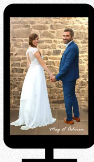
Ecran secondaire pour diffusion des photos en diaporama