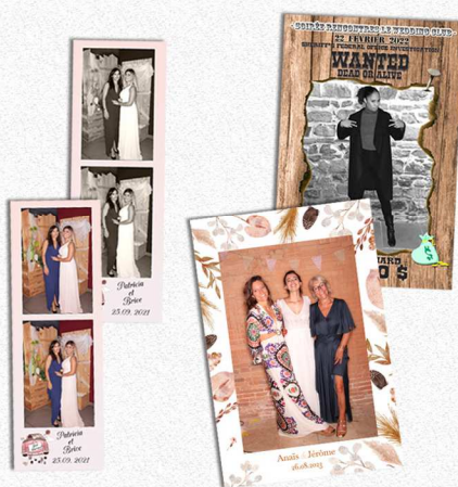
ou Format 10x15 cm