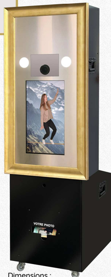
Dimensions : 55 x 55 x 175 cm

Le STAND UP MIRROR est un produit conçu et développé par ANIMAPHOT FRANCE