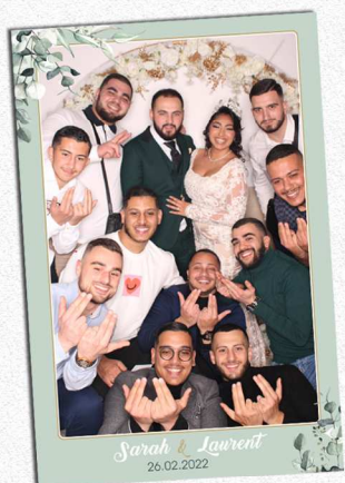
Format 15x23 cm