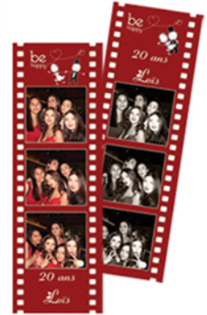
Strips photomat Marques Pages