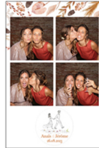
Multi vues par 2/3 ou 4