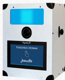
Nouvelles finitions Blanc ou Noir moucheté