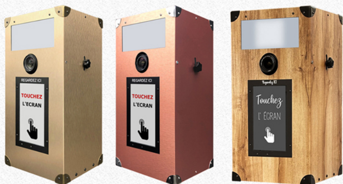
Finitions Doré, Cuivre et Bois